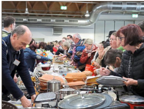
Verhandeln, feilschen und so viel wie möglich verkaufen war angesagt. Denn der Erlös geht komplett an soziale Zwecke.