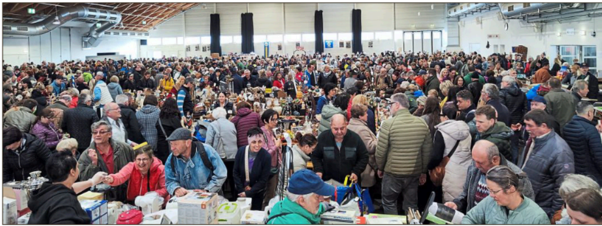
Bis zu 20.000 Besucher, verteilt auf zwei Tage, strömten in die Messehalle zum Lions-Trödelmarkt.