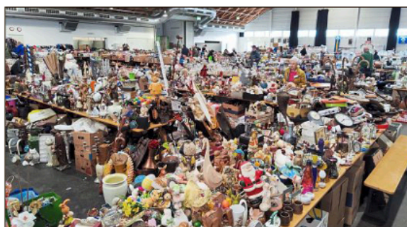
Die Ruhe vor dem Sturm. Bevor die Besucher in die Halle strömten, wurden die Bierbänke mit allerlei Artikel und Waren befüllt.